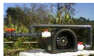
Ejemplo PLT con kit hidráulico (opcional)