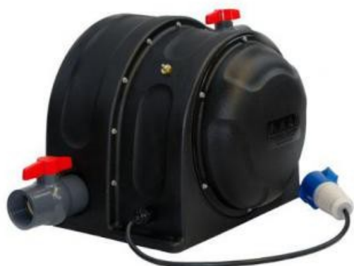
Ejemplo PLT con válvula entrada suministrada