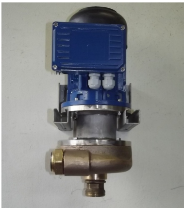
Microturbina hidraulica TF-300 a 12 ó 24Vcc

Microturbina de reacción que se puede instalar en by-pass a una válvula de control o reductora de presión.